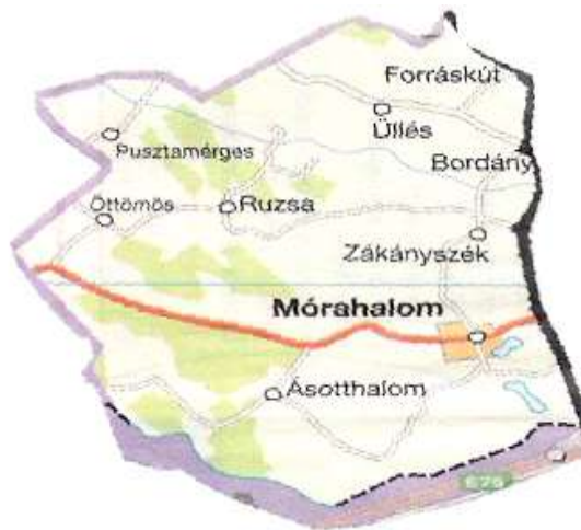
1. kép Az őrs illetékességi területe