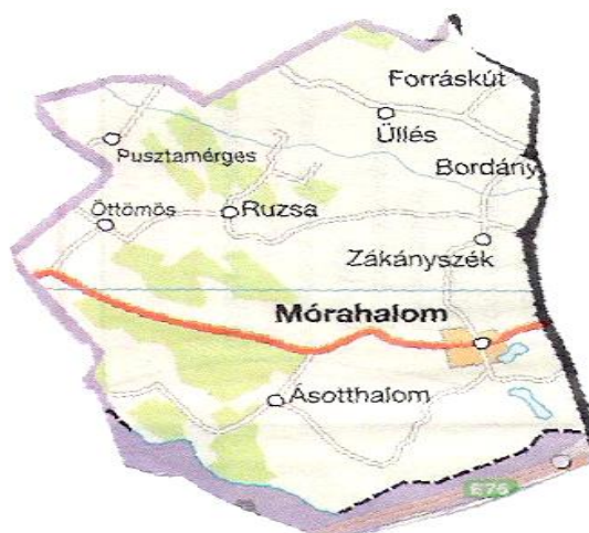
1. kép Az őrs illetékességi területe