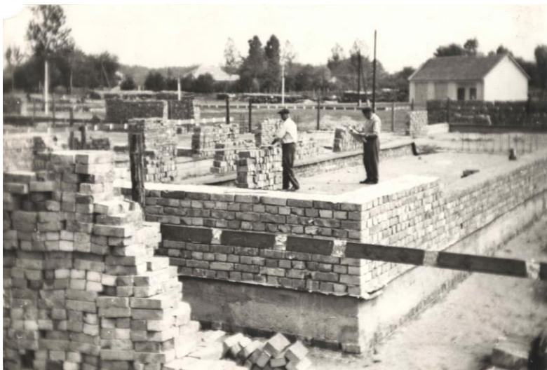
Épülő művelődési ház (1964)

Az egyszeri rendezvényeken főleg a vendég előadók vagy szervezetek műsora szolgálta a szórakoztatást. Az év eleji közgyűlések, bálók a külső szervek által kerültek megvalósításra. Színházi jellegű előadások a Magyar kultúra napjától karácsonyig 26-szor hívták nézőinket a művelődési házba, vagy a nemzeti és kiemelt helyi ünnepek helyszínére. Az évfordulók alkalmat teremtettek egy kis visszatekintésre, milyen volt, milyen lett például a kultúra 50 év alatt. A művelődési ház régi fotói megdobogtatták látogatóink - köztük régi dolgozóink - szívét a tavalyi falunap előestéjén, a bővítés átadására tartott ünnepség alkalmával. A testvértelepülések vendégeskedése néha fellépéseket, néha játékokat, de mindenképpen kulturális megnyilatkozást jelent.