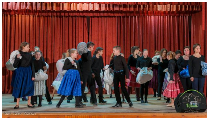
Magyar kultúra napja – színházi előadás

Az egyszeri rendezvényeken főleg a vendég előadók vagy szervezetek műsora szolgálta a szórakoztatást. Az év eleji közgyűlések, bálók a külső szervek által kerültek megvalósításra. Színházi jellegű előadások a Magyar kultúra napjától karácsonyig 26-szor hívták nézőinket a művelődési házba, vagy a nemzeti és kiemelt helyi ünnepek helyszínére. Az évfordulók alkalmat teremtettek egy kis visszatekintésre, milyen volt, milyen lett például a kultúra 50 év alatt. A művelődési ház régi fotói megdobogtatták látogatóink - köztük régi dolgozóink - szívét a tavalyi falunap előestéjén, a bővítés átadására tartott ünnepség alkalmával. A testvértelepülések vendégeskedése néha fellépéseket, néha játékokat, de mindenképpen kulturális megnyilatkozást jelent.