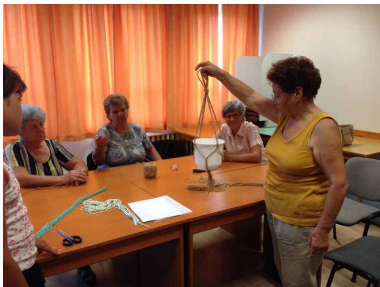
Munkában a Femina Kör

A helyi társadalom kapcsolatrendszerét, közösségi életét, érdekérvényesítését mozdítjuk elő a szabadidő kulturális célú eltöltéséhez létrehozott programokkal.