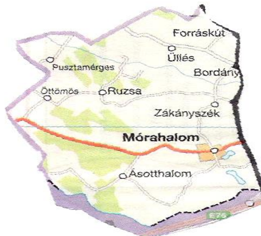
1. kép Az őrs illetékességi területe